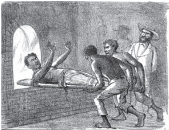
Contam-se horrores sobre as atrocidades dos barbares senhores. Escravos tem sido metidos vivos em fornos incandescentes,

Uma intensa pressão popular resulta na libertação dos negros no Ceará, em 1884. Uma aguda crise na lavoura e reflexos da seca de 1877, além da ação de grupos urbanos, inviabilizaram o regime de cativo na região. Incentivado por esse desenlace, o abolicionismo toma ares de movimento em diversas províncias, como Rio Grande do Sul, Amazonas, Goiás, Pará, Rio Grande do Norte, Piauí e Paraná.